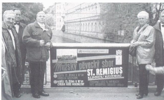
De publiciteit werd ook in Tsjechië niet vergeten.

St. Remigius sluit op 19 oktober het 40-jarig jubileum af met een Heilige Mis. Aansluitend wordt op het kerkhof, zoals elk jaar gebruikelijk, Dobra Noc gezongen, dit ter nagedachtenis aan overleden leden en familieleden. Aansluitend is er een samenzijn van leden en oud-leden in het verenigingslokaal.