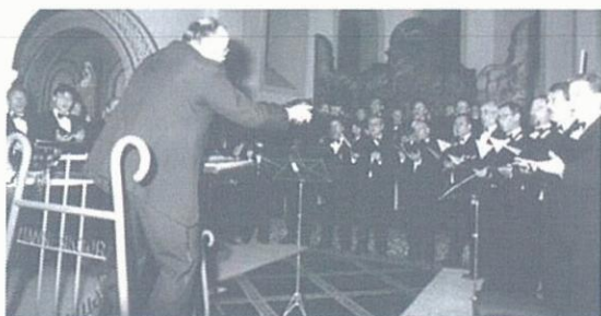
St. Remigius in volle overgave.