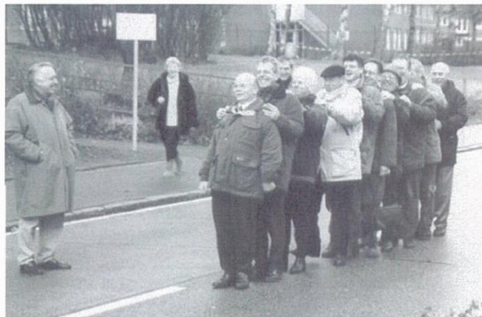
De zangers in de paradepas.

Bij aankomst in het plaatsje Zeven wordt het koor door adjudant Marx ontvangen in