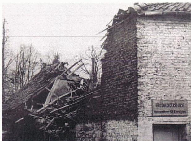
Het geboortehuis in verval.