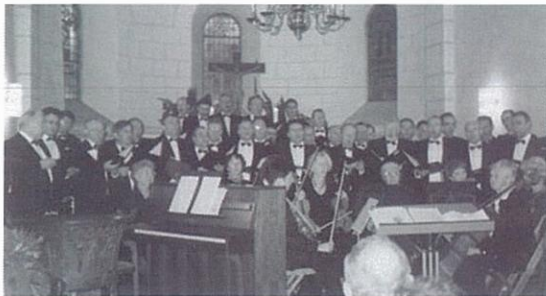
De Oecumenische dienst in Zeven (D).

De kroon op het jaar is de concertreis naar de legerplaats Seedorf in Noord-Duitsland. Het mannenkoor gaat er in december drie dagen heen op uitnodiging van de daar gelegerde Nederlandse militairen. Voor het eerst in de geschiedenis wordt het een reis