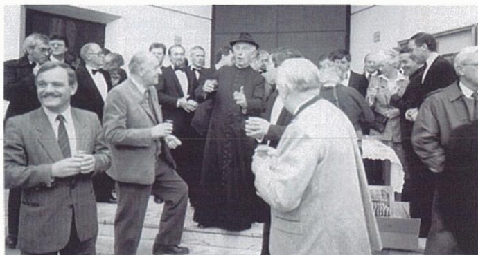
Na de Hoogmis in de kerk van Pernitz de toast met de pastoor in het midden.

De laatste dag reist Remigius naar Wenen, dat in de buurt ligt. Onder de indruk van deze grote en imposante stad, waar ook muziek vandaan komt dat het koor zingt,