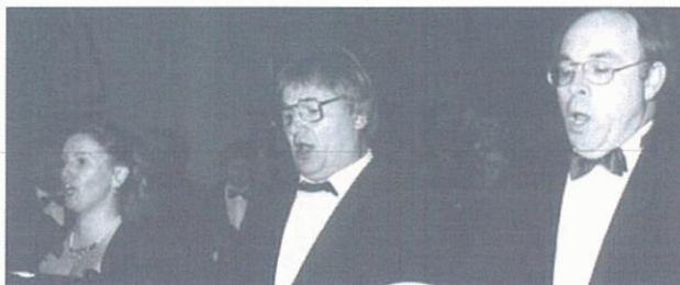
De drie solisten.