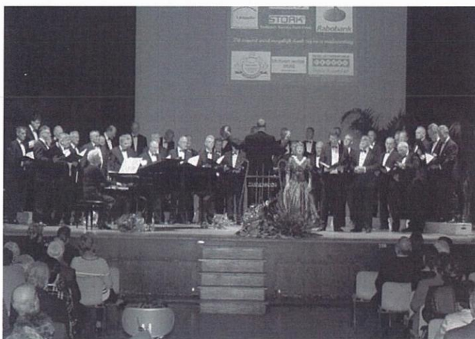
Koor en solisten tijdens het concert.