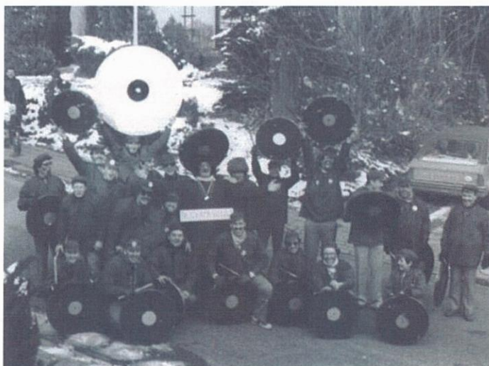
Mannenkoor St. Remigius in de carnavalsoptocht.

toehoorders en van een gezellige sfeer is ook geen sprake. Een echte teleurstelling is het pas als later blijkt dat de Avro slechts één werk uitzendt. Pleister op de wond is een goede recensie in de krant, waarin een muziekjournalist schrijft dat St. Remigius zeer gedisciplineerd en klankrijk heeft gezongen.