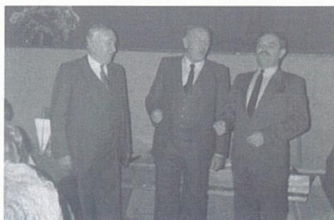
De drie zingende burgemeesters uit Pernitz, Gutenstein-Klostertal en Voerendaal

In de vroege ochtend verzamelt iedereen zich bij het verenigingslokaal Claessen. Terwijl het stormt en regent, zoekt iedereen een plekje in een van de bussen. Eenmaal veilig aangekomen in Pernitz verwelkomt een groep zangers van de MGV Pernitz hen. Na de kennismaking is er tijd om de omgeving te verkennen. 's Avonds staat gelijk het eerste concert op Oostenrijkse bodem op het programma. De akoestiek van de zaal en de belangstelling van de plaatselijke bevolking is prima. Het concert valt goed in de smaak bij de enthousiaste Oostenrijkers. Na afloop volgt