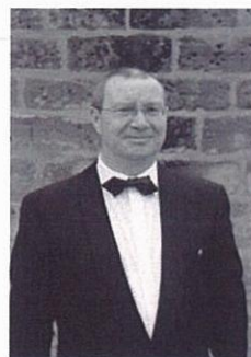
Sjr Pisters voorzitter Club van Vijftig

Hierbij een woord van dank aan alle leden van de Club van Vijftig voor hun sympathie voor de mannenkoorzang en voor ons koor in het bijzonder. Ook dank voor hun financiële bijdrage aan het welslagen van ons gouden jubileum. Ik hoop dat zij, ook na de viering van het gouden jubileum, sympathisant van ons koor blijven en zij kunnen blijven genieten van onze muzikale vertolkingen.